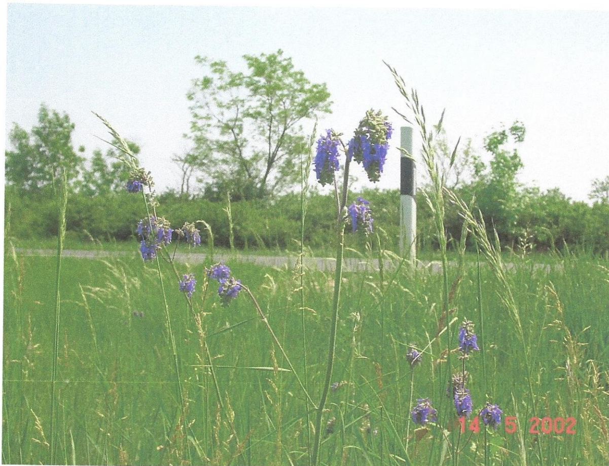
44-es számú Főút mellett Természetvédelmi Terület (Kondoros külterület)