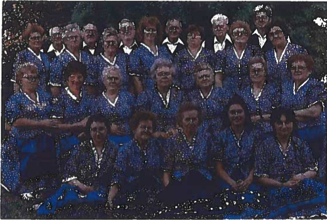
Csoportkép, amelyen a kékfestő viseletű fellépő ruha látható.