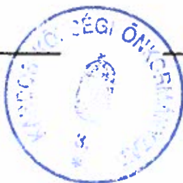
Tinka Edit jegyzőkönyv-hitelesítő